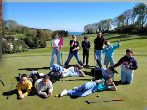
64 enfants pour la 1 ère semaine des vacances d'hiver et pour les deux semaines des vacances de printemps.