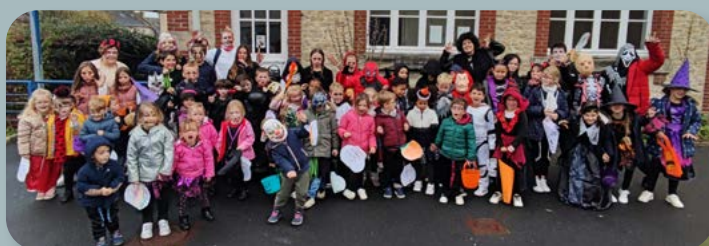
72 enfants lors de la 1 ère semaine de la Toussaint et 56 la 2 de .

Le nombre croissant d'inscriptions, nous a contraint à instaurer des listes d'attente afin de pouvoir répondre au mieux à toutes les familles qui nous sollicitent.