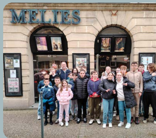
Le local jeunes : les vendredis de 18h à 21h 42 jeunes âgés de 11 à 17 ans se sont inscrits au local. Ils ont activement participé aux soirées à thèmes, sorties ou accueils au local.

L'ensemble des témoignages élogieux et les nombreux retours, plus que positifs, nous permettent de poursuivre dans la même direction avec comme objectif principal : le bien-être de l'enfant.