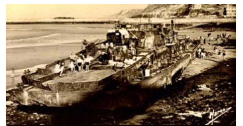
Épave d'une canonnière allemande.

Les maisons atteintes par les bombardements et dont les murs menacent de s'écrouler sont dynamitées par les Anglais. Les Allemands étaient retranchés sur les falaises qui encadrent la ville et, sauf 3 chalands de DCA qui ont été coulés dans le port, Port-en-Bessin lui-même n'abritait aucune véritable position militaire allemande.