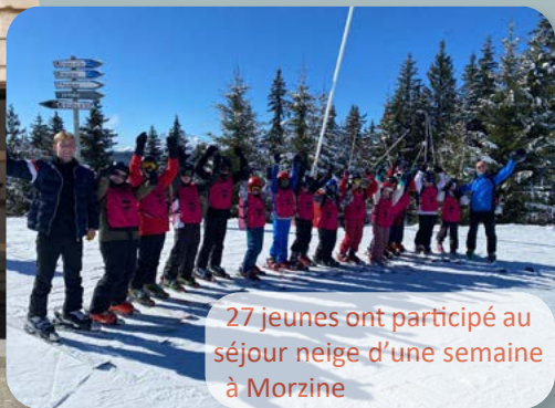
27 jeunes ont participé au séjour neige d'une semaine à Morzine